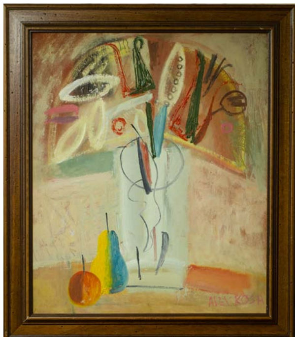
Алекс Кош «Натюрморт» ДВП, акрил, 65x55 см