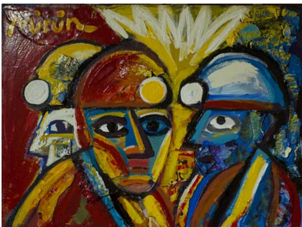
Роман Мінін «Заради якого світла ми добуваємо вогонь»