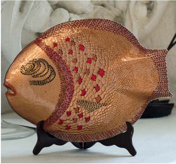
Красуцька Марія «Риба декоративна» Художній розпис, акрил