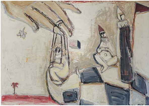
Юрій Сивирин «Діти рейка» Змішана техніка, 100 x 70 см