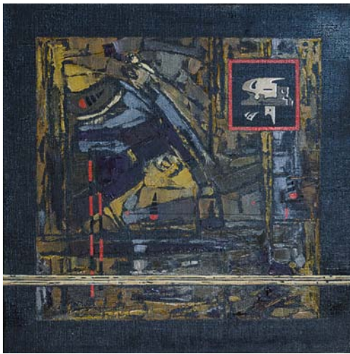
Герман Міготін Диптих «Трансформації 3» Полотно, олія