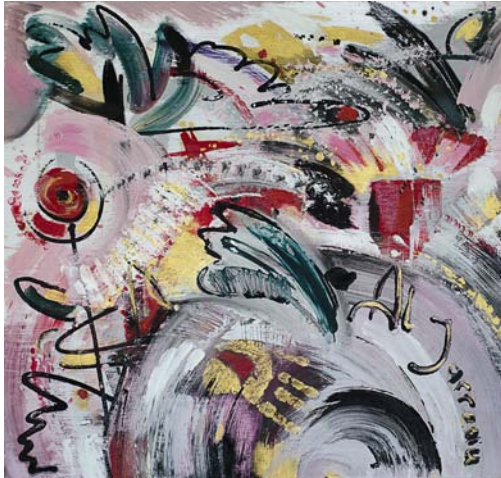
Людмила Санік «Поцілунок» Полотно, змішана техніка, 60х60 см