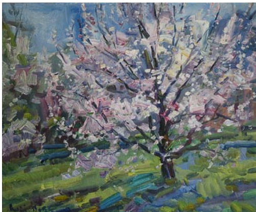
Сергій Вовк «Зацвіла мареля» Полотно, олія, 50х60 см