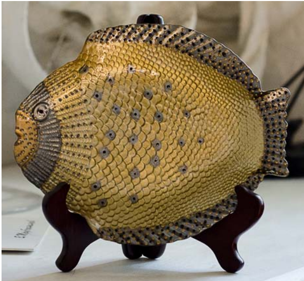
Красуцька Марія «Риба декоративна» Художній розпис, акрил