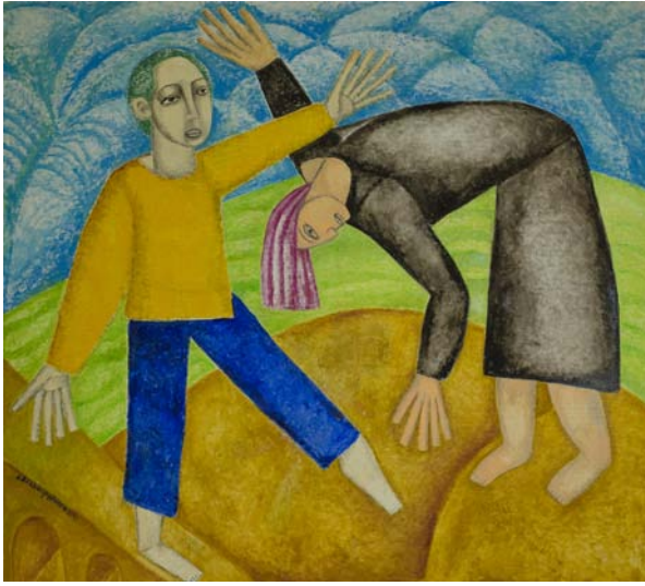
Євген Ройтман «Поклоніння пришедшого»