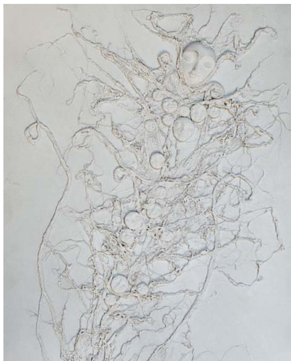
Александрович Ира «Радість дитинства» ДВП, 40x30 см